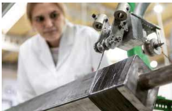
GAIKER investiga en composites y sus procesos de fabricación.

Participa en JEC 2026 dentro del Pabellón España, consolidando su posición como centro tecnológico de referencia en el diseño, procesabilidad y reciclado de materiales compuestos. Con cuatro décadas de experiencia, GAIKER es pionero en la investigación de composites y presentará en JEC nuevos demostradores.