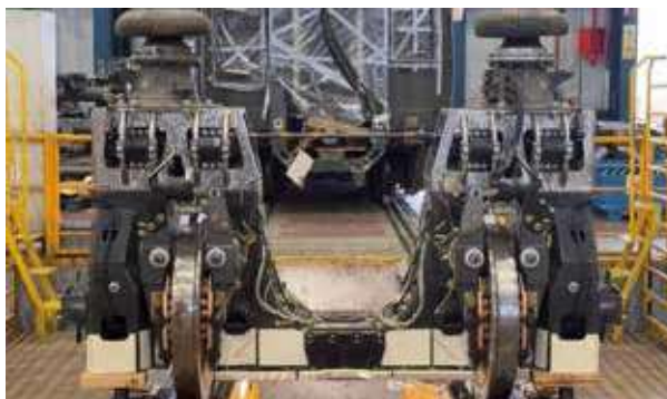
Rodal Ligero. Ensayos en una vía.

Nuestro objetivo es seguir avanzando en la sostenibilidad, reciclabilidad y ligereza de nuestros trenes. Para esta edición presentaremos demostrados de piezas ferroviarias fabricadas en material compuesto, incorporando tanto resinas de origen biológico como termoestables recicladas y reciclables.