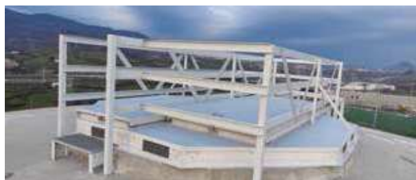
Depuradora La Florida, Bilbao. Perfiles pultruidos.

Estas iniciativas responden a la creciente demanda del mercado de soluciones que combinen ligereza, resistencia y eficiencia con criterios sólidos de sostenibilidad. Durante