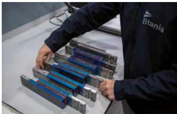
Preparación de muestras de núcleos en el taller.

Desde sus instalaciones en El Puerto de Santa María en Cádiz (España), Titania gestiona proyectos tecnológicos para la industria aeroespacial que incluyen la fabricación y caracterización de materiales compuestos para más de 200 empresas internacionales en 35 países.