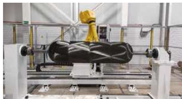
Fabricación de tanques de H2 de tipo IV por Filament Winding.

Además, la empresa presentará avances en optimización de procesos y reducción de huella de carbono, reafirmando su apuesta por la innovación y la excelencia en ingeniería.